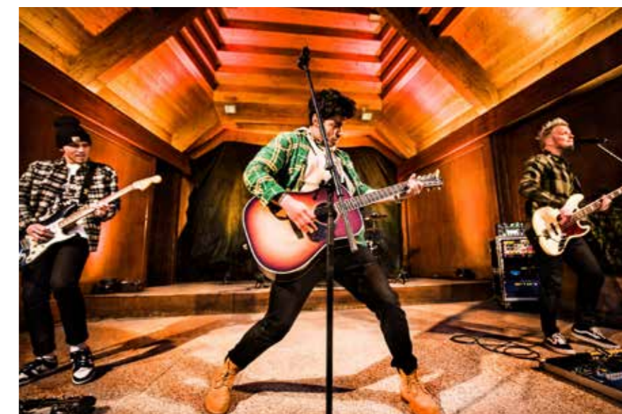
Kapela Mirai v rámci koncertu Muzika na horách

2016. Ondřej tam byl jako producent a kytarista Lenny. Po koncertu jsme si vždy povídali a jednou za mnou přišel jako kytarista, který píše písničky, že má napsané nějaké songy, které by s námi chtěl udělat. Já to tenkrát nebral moc vážně, protože jsem byl přesvědčený, že si písničky dokážeme napsat sami a nepotřebujeme nikoho, kdo by se nám v tom vrтал. Vlastně jsem ani nevěděl, kdo je to producent. Tehdy to tedy nedopadlo, ale pak jsme psali písničku Když nemůžeš, tak přidej,