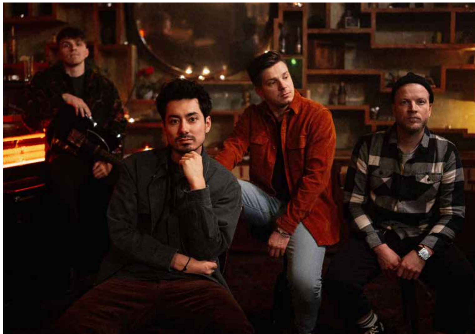
Kapela Mirai při natáčení videoklipu Lítej