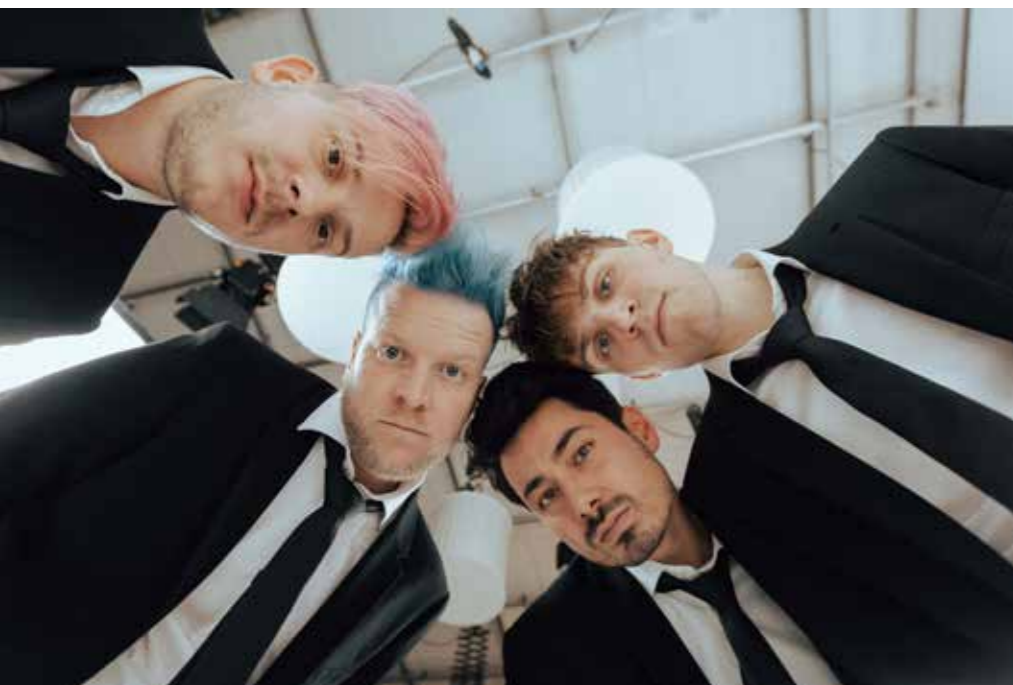
Kapela Mirai

Doba je čím dál rychlejší a životnost písniček kratší. Je třeba pořád něco vymýšlet. Napsat dobrou desku nebo dvě není důvod k tomu, proč by lidi za deset let měli chodit na naše koncerty. Znovu – není to sprint, je to maraton.